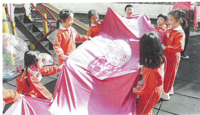
學校善用社區設施，為學生提供不同戶外學習的機會。

學校將課程分為顯性和隱性，校長楊劍欽認為兩者若能成功結合，能夠有助學生發展。所謂顯性課程，是指學校所提供的，為正式、預先準備好和模擬性的學習；至於隱性課程，則指是非正式，透過自然和真實的學習，發生於學校、家庭、社區和周遭環境中。學校本着「以兒童為中心」的教育理念，透過「故事綜合（顯性）+ 遊戲學習（隱性）」校本課程模式，以綜合不同學習範疇的內容和基礎能力的發展，讓學生能愉快學習，以助其身心全面均衡發展。