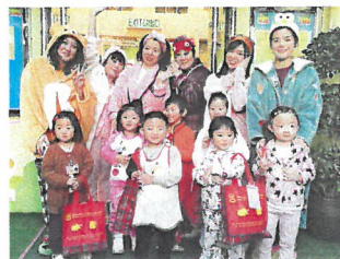
學校會舉辦不少具特色的活動，圖為師生睡衣派對。

聽故事有助發展思維，故於顯性課程方面，學校以故事作教學線索，發展孩子語文、創意和表達。同時學校相信故事是良好的媒介，可令孩子領略抽象的價值觀，以故事綜合不同的學習範疇，透過情境、人物、文字，讓兒童親身經歷，從而引起求知慾，讓他們愉快學習。現時學校除採用幼教專家李輝博士所創立的綜合故事教學法發展校本課程，還加插了老師搜集的精采故事，師生常一起發展故事。楊校長表示，當小朋友成為故事主角，對由故事發展出的任何一項學習經歷，印象都會特別深。改編故事期間，他們已學會聆聽別人，最後老師會讓小朋友評論自己的角色，以及指出欣賞別人的地方，這點是很重要的，因校方希望建立讚賞的文化。教學法亦有利學生升小後課程銜接，透過朗讀故事和閱讀，讓孩子認識許多新詞彙，提升語言發展，增強表達能力，從而建立自信心。