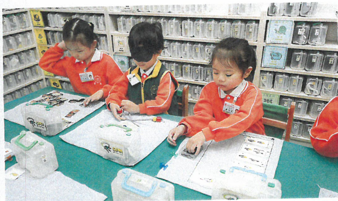
學校設有遊戲為本的「玩具圖書館」，共有逾500項「玩具寶盒」，寶盒以數理邏輯為主，遊戲內容由淺至深，能有效照顧個別差異，同時建立良好常規。