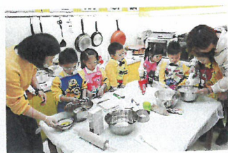
學校增設了多元化的遊戲室，學生可以在烹飪室親自煮食，在真實情景中探索和解難。