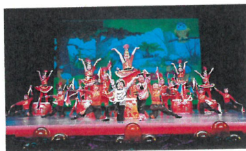
學校的舞蹈隊成績驕人。