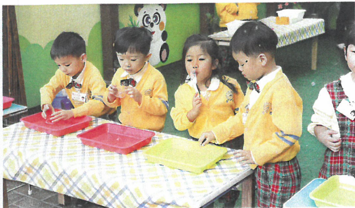
學生會於課堂上進行探索式研習活動。